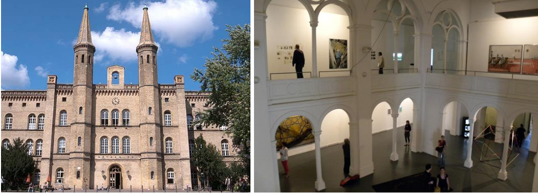
"Kunstquartier Bethanien", Berlin

Die IAM Ausstellungen finden im "Kunstquartier Bethanien" in Berlin statt, einem ehemaligen, historischen Diakonischen Krankenhaus mit einer starken, politischen Geschichte mitten im Herzen von Berlin Kreuzberg. Seit 2010 wird dieser Ort vom „Kunstquartier Bethanien“ für Künste aller Medien, Künstlergruppen und kulturelle Institutionen genutzt.